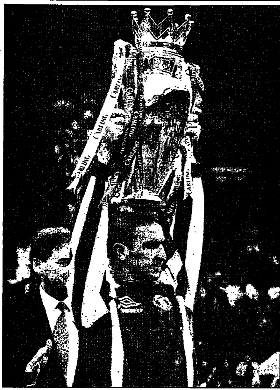
كانتونا كايان ماشستر يوناييتد يرفع الكأس الذي فاز به الفريق بعد مباراة مع ويستهمام يوناييتد أمس الاول مسجلاً الفوز الرابع على التوالي

فقتلص الفارق الى 4 نقاط بيته وبين منافسه ليايفرس ساو باولو الذي تعادل مع ساو جوزيه 1-1. وفاز يوناتوفو على اراستونيا 2-3 وأمريكا على ريفر بلاتو 3-2، وغواراني على بورتو سانلوسينا 1-صفر، وپولتوس على موني ميوز 3-1. ترتيب المجموعة الاولى: 1- بايلاس 42 نقطة 2- بورتو سانلوسينا 40 3- سانتوس 40 4- غواراني 24 5- ساو جوزيه 20 6- بورتو سانلوسينا 17 7- ساو باولو 17 8- ساو جوزيه 14 9- ساو باولو 14 10- ريو بلاتو 13 11- انترناسيونال 12 وفي باريس عندما يتزل ليواردو رونالدو وهو في ارض ملعب نادي بريتانيا زيا واحدا وهو في منتخب البرازيلي لكرة القدم ولكن الامر سيختلف غداً اذ سيصاحبا في بايرونيا. البرازيليين اذ سيصاحبا في بايرونيا مع فريقه برشلونه الاسباني ضد موطنه ليواردو الحترف بياريس سان جيرمان الفرنسي عندما يوجهه الفريقان بعضهم البعض بالروح الكهفاني بطولة اوروبا للاندية ابطل التتويح في روتردام. وقال ليواردو وهو يستعد مع فريقه هينغا ضد بعضا البعض مرة واحدة من قبل عندما كان رونالدو يلعب لكرولو وانا لساو باولو وتعامل الفريقان 1/1. ولم تلعب دائما مع بايرونيا باستثناء ذلك تلعب دائما مع البرازيليين. واضاف جيجان ان تحسرس من رونالدو. وقال بياريس سان جيرمان ان يصبح اول فريق يفوز بالبطولة موسميين متتاليين منذ ان بدأت موسم 1960. ويلاقي ليواردو في المباراة الثانية في روتردام، وفي ساو باولو (البرازيل) خسر بايرونيا على ارضه امام ساو باولو 1-0. وفي المباراة الثانية في روتردام، وفي ساو باولو (البرازيل) خسر بايرونيا على ارضه امام ساو باولو 1-0. وفي المباراة الثانية في روتردام، وفي ساو باولو (البرازيل) خسر بايرونيا على ارضه امام ساو باولو 1-0.